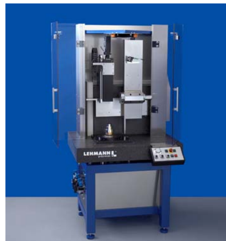
Tour d'ajustage pour la fabrication de lentilles