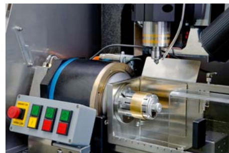
Fraiseuse CNC pour l'usinage de l'or

Tous les composants des machines sont conçus sans compromis pour une fabrication en série en trois équipes de travail.