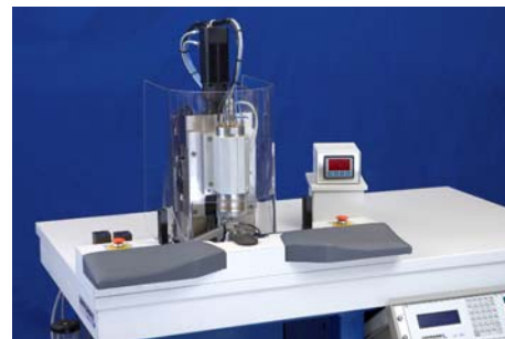
Fraiseuse CNC de précision pour micro-pièces

À partir de nos composants, nous construisons des tours, fraiseuses et machines spéciales spécifiques aux clients, pour l'usinage de petites pièces, qui satisfont aux exigences les plus sévères en matière de précision, de qualité et de sécurité du processus.