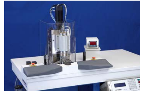
CNC-Präzisionsfräsmaschine für Mikroteile

Aus unseren Komponenten bauen wir kundenspezifische Fräs-, Dreh- und Sondermaschinen für die Bearbeitung von Kleinteilen. Diese erfüllen allerhöchste Ansprüche bezüglich Präzision, Qualität und Prozesssicherheit.