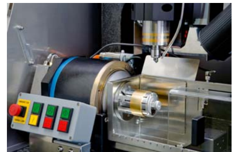
CNC-Fräsmaschine für die Goldbearbeitung

Alle Komponenten der Maschinen werden kompromisslos für Serienfertigung im Dreischichtbetrieb ausgelegt.