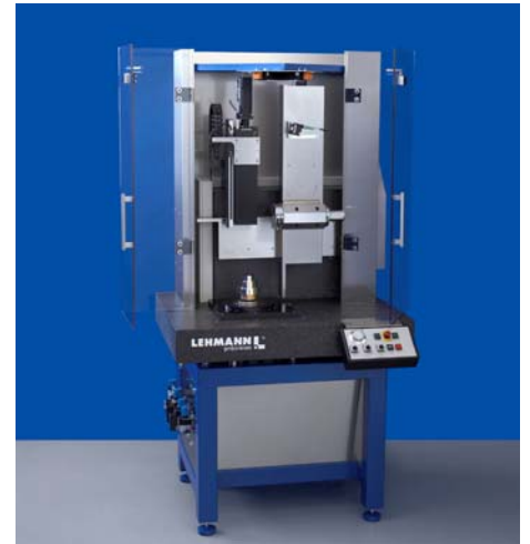
Justierdrehmaschine für die Linsenfertigung